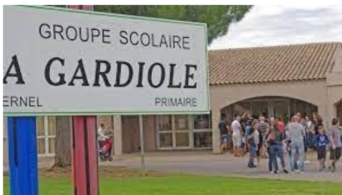
Groupe scolaire la Gardiole

La commune de Fabrègues fait partie de la métropole de Montpellier et à ce titre, les services du Pôle Enfance-Jeunesse travaillent en réseau avec les autres communes. De même, un lien privilégié avec l'Ecolothèque permet de renouveler l'offre ludique, culturelle et éducative des équipes municipales d'animation qui s'y rendent régulièrement en formation.