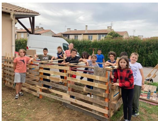
Composteur installé devant le restaurant scolaire des grillons, fabriqué par les enfants en 2023