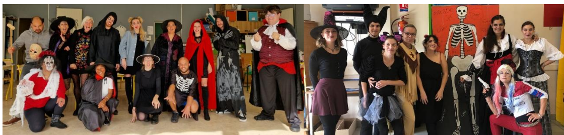
Equipe ALP Cigales/Formigueta/St Jacques