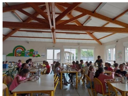
Le réfectoire du groupe scolaire la Gardiole - 2023

Les menus sont élaborés par le chef cuisinier responsable du service de restauration scolaire, et ses seconds. Le restaurant scolaire des Grillons accueille tous les midis les enfants de trois écoles : Saint Jacques, Formigueta et Cigales. Le réfectoire de l'ALP groupe Gardiole est situé au centre du groupe scolaire et accueille les enfants de l'école maternelle et ceux de l'école élémentaire. Les plats sont livrés depuis la cuisine du restaurant scolaire des Grillons en liaison chaude.