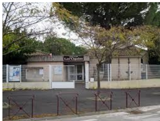
Ecole élémentaire des Cigales