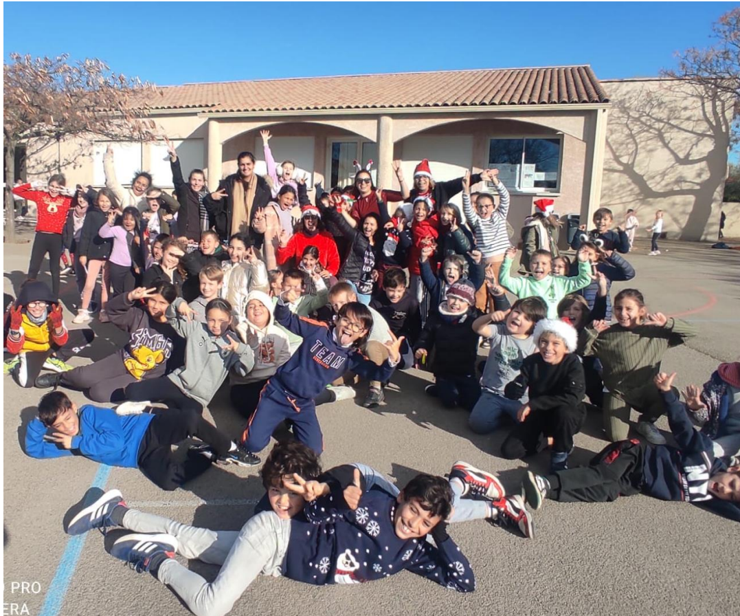
Les enfants de l'ALP Gardiole elementaire