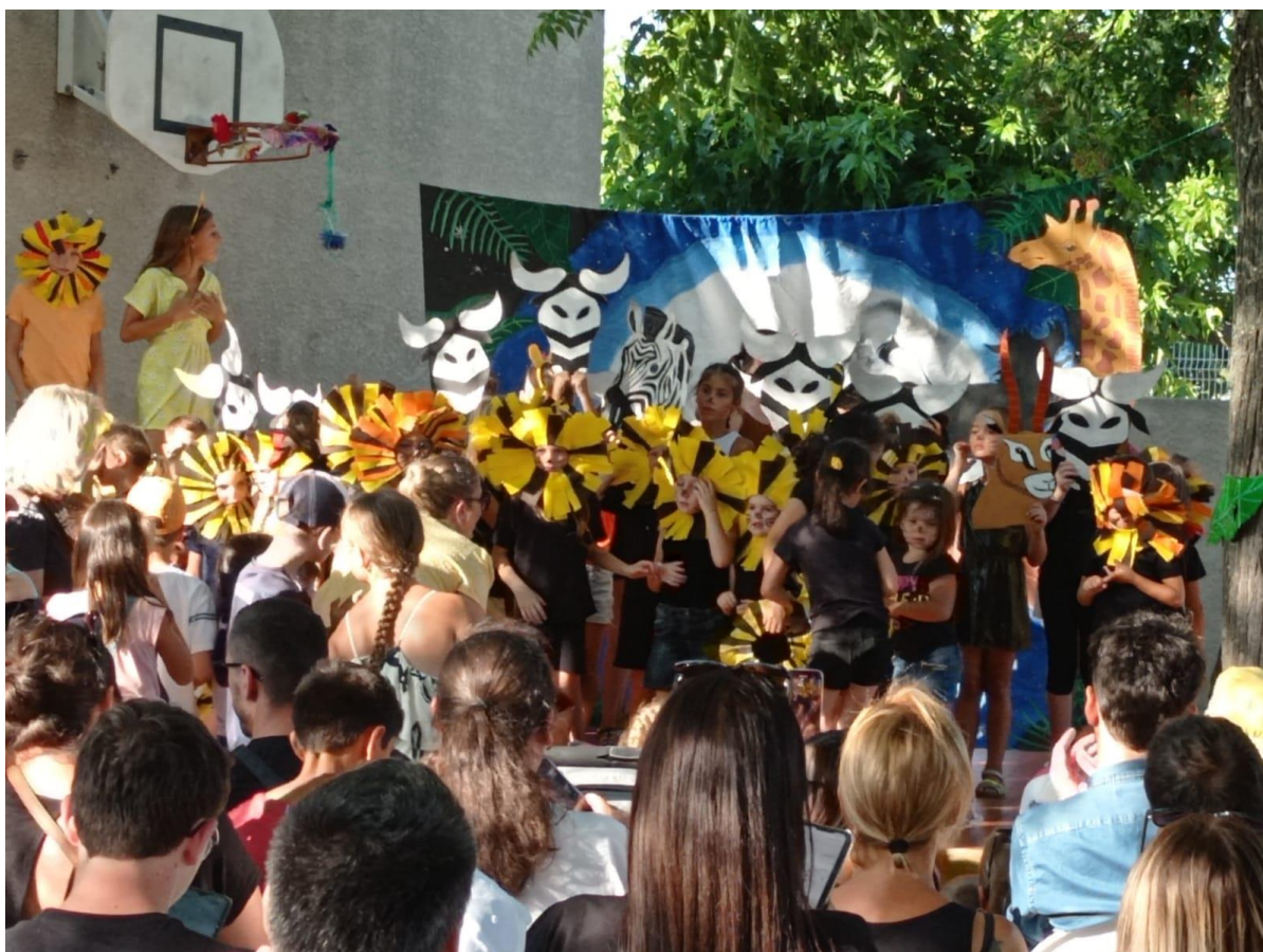
Spectacle de fin d'année de l'ALP Gardiole - juillet 2023

PRIS EN APPLICATION DE LA DÉCISION DE LA COMMISSION ENFANCE-JEUNESSE- ECOLES DU 18 SEPTEMBRE 2023