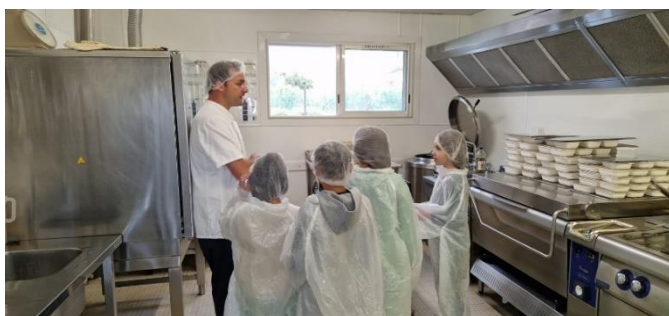
Visite des cuisines des Grillons par les enfants de l'ALP du matin.

L'ALP du matin ouvre à 7h00 et permet une arrivée échelonnée des enfants jusqu'à 8h20 . Un accueil ainsi qu'une écoute attentive sont portés par les animateurs à leur état physique et émotionnel. Un espace confortable est aménagé pour les enfants qui ne sont pas encore bien réveillés. Des activités calmes, dessin, coloriages, lecture, jeux d'éveil sont mises en place.